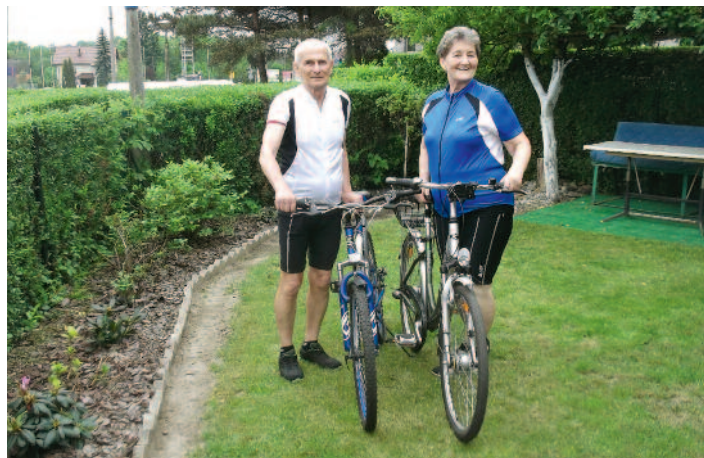
Wycieczki rowerowe to ciekawy i zdrowy sposób na wolny czas