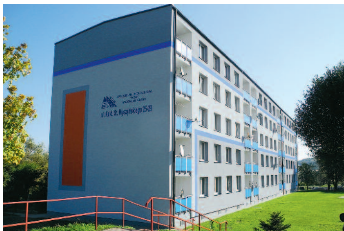
Termomodernizacja budynku na ulicy Wyszyńskiego