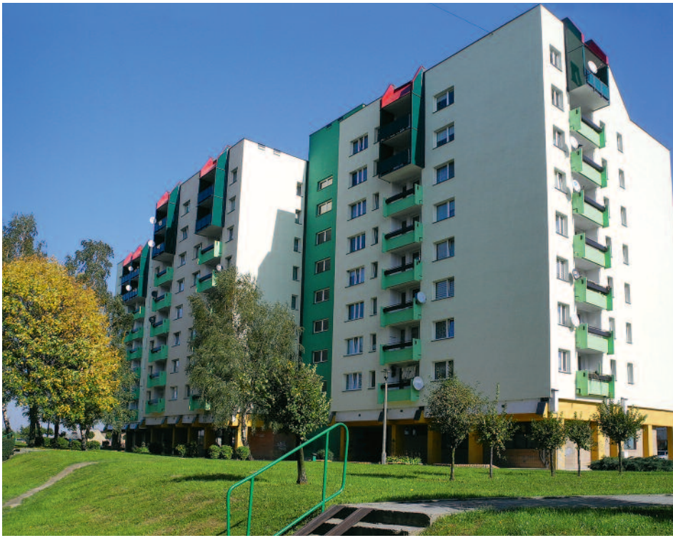
Ocieplenie budynków przy ul. Przemysława 3 i 9