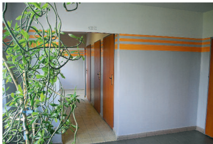
Remont klatek schodowych XXX-lecia 101-104