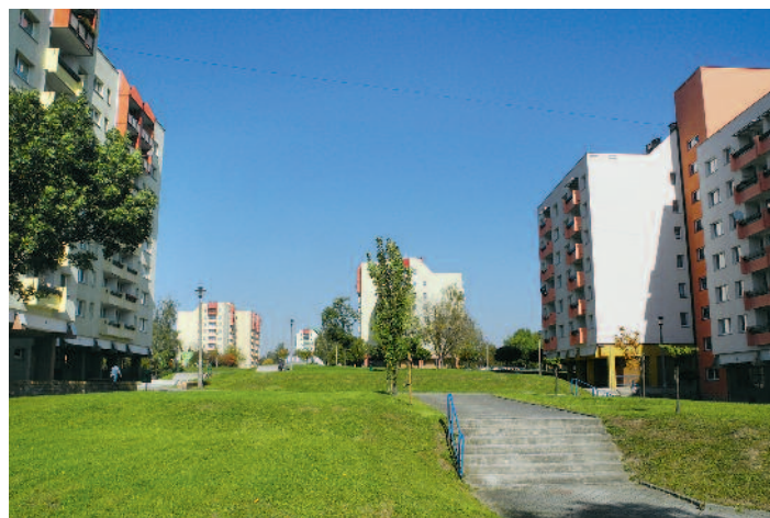
Ocieplenie budynków na Osiedlu Piastów