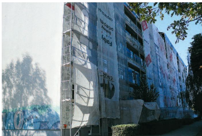
XXX-lecia 101-104 blok, który został poddany nowemu sposobowi renowacji

Trwa termomodernizacja budynku na ul. Krzyżkowickiej 20 w Rydułtowach. W tym roku działaniom energooszczędny